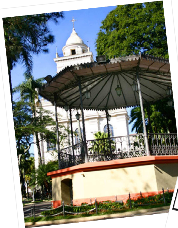
Itatiba - SP. 1973