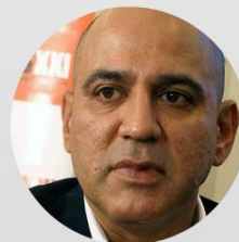
Ex Tte. Jesse Chacón Ministerio de Electricidad