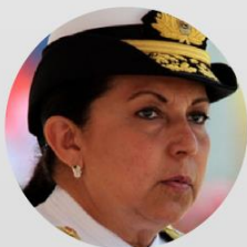
Almirante Carmen Meléndez Ministerio de Defensa