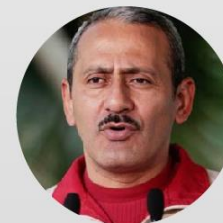
Gral. Carlos Osorio M. del Despacho de la Presidencia y Seguimiento de la gestión del Gobierno

También es ministro de Estado para la Región Guayana y presidente de CVG Internacional.