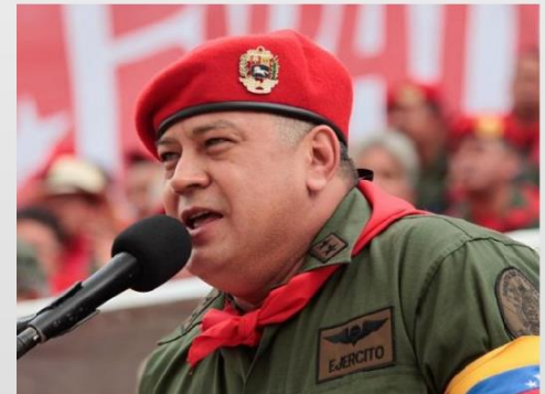
Presidente: Capitán Diosdado Cabello

De 23 estados 12 tienen gobernadores de procedencia militar