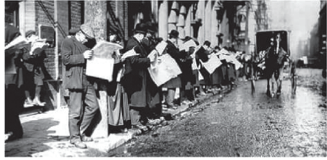
A tecnologia não explica tudo: nossa relação compulsiva com a tecnologia não é de ontem...

Esse movimento de personalização entra em tensão com uma tendência, contrária, a uma mais acentuada padronização do trabalho. A combinação desses dois fatores pode engendrar uma relação com o trabalho marcada pela dureza, tal como prefigurado pela difusão do digital, a do “cada um por si”, um mundo em que cada qual se torna “o empreendedor de si mesmo” (Michel Foucault 19 ), “o marketer de suas próprias competências” e, por extensão, uma mercadoria que se vende a quem pagar mais (mecanismos de leilões invertidos nas plataformas). Paradoxalmente, a sociedade da hiperconexão compõe um novo individualismo, cuja quintessência é o Facebook, grande coletor de narcisismos globalizados e provedor dos umbiguismos digitais. Do indivíduo-rei do sociólogo ao tudo-pa-